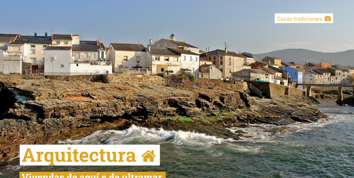
Casas tradicionais 📍