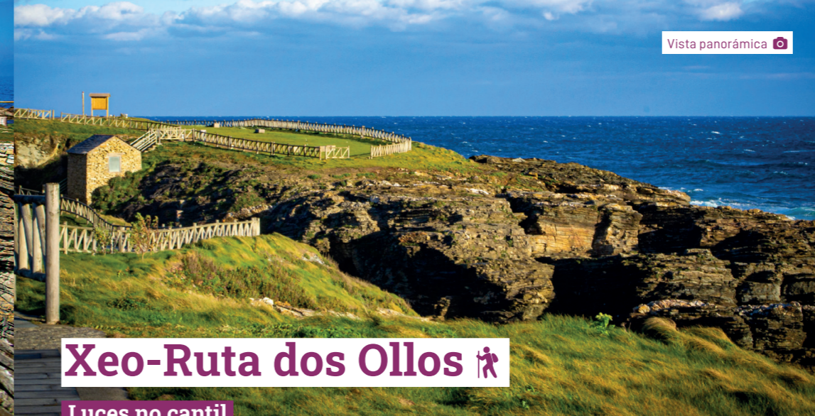
Vista panorámica 📍

+info sobre o Camiño Natural Roteiro do Cantábrico