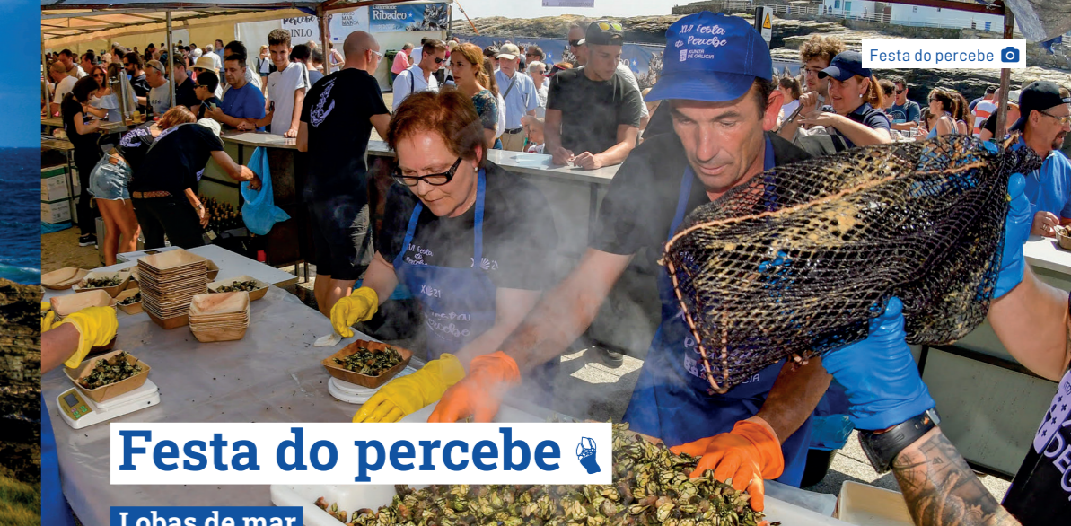
Festa do percebe 📍

En Punta Corveira, punto final deste roteiro, chamada así pola presenza de corvos mariños , podemos observar un novo fenómeno xeolóxico, resultado da interacción entre o salsero mariño e os grans de minerais presentes nas rochas, dando lugar a unhas estruturas circulares a modo de "cazoliñas". Este fenómeno coñécese como haloclastia .