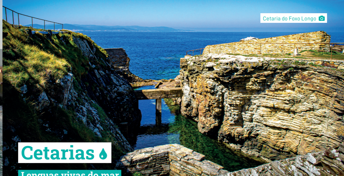
Cetaria do Foxo Longo 📍

Por ser o punto máis elevado de Rinlo e estar situado nas proximidades da liña de costa, o miradoiro da Casa de don Inocencio foi utilizado como faro, o primeiro desa zona de litoral, sendo o primeiro faro do Cantábrico instalado nun inmoble privado e , polo tanto, custeado polo propietario do edificio.