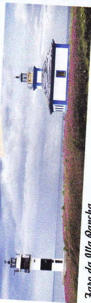
Faro da Illa Pancha

TENEMOS UNA PROPUESTA PARA TÍ, que realices la ruta de la costa desde As Catedrais hasta la villa de Ribadeo (a pie, andando, en bicicleta, en coche...)